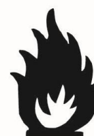
Tout produit extrêmement inflammable