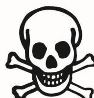
Tout produit chimique exceptionnel