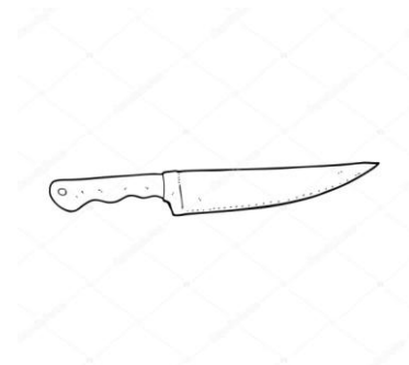
Tous les couteaux

Certains objets pourront être conservés en consigne.