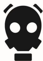
Toute bouteille de gaz