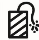
Tout feu d'artifice, pétard, fusées de dé- tresse, briques allume- feu, gaz lacrymogène, pistolet factice...