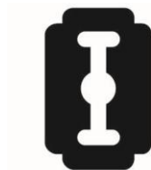
Objets tranchants, contondants, coupants