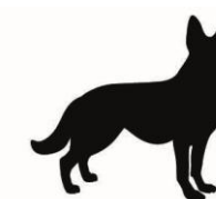
Animaux (Sauf chiens d'aveugles)