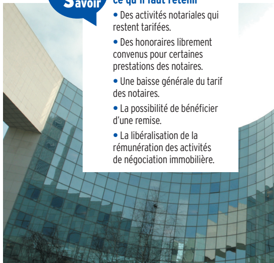
Deux textes du 26 février 2016 viennent de fixer le nouveau tarif des notaires