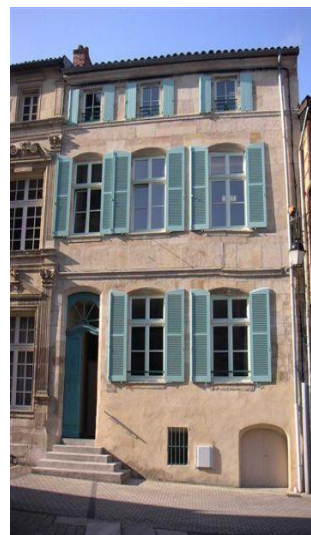
le tribunal d'instance