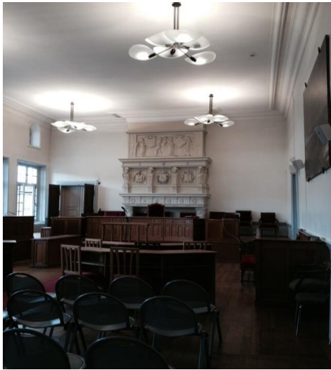
La salle d'audience du TGI

Le tribunal dispose de deux salles d'audience (une au tribunal de grande instance d'une contenance de 60 places, une partagée entre le tribunal d'instance et le conseil de prud'hommes) et de deux chambres du conseil (la bibliothèque du tribunal de grande instance, une salle au tribunal d'instance).