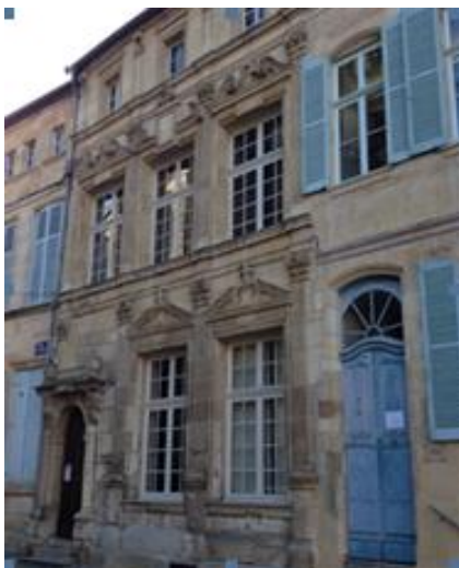
Le conseil de prud'hommes