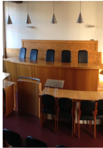
La salle d'audience du TI/CPH